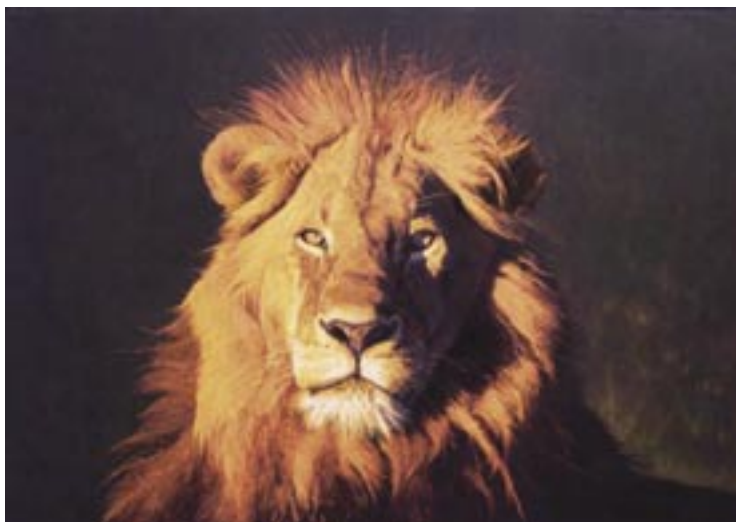
Leone. Opera di Stefano Cecchini. Olio su tela.

Il nostro Chapter ha contribuito con la ragguardevole somma di $ 10.000 al programma di studi sulla popolazione dei leoni africani e per la salvaguardia della specie. Questi studi, che sono stati promossi dal C.I.T.E.S. ed affidati per l'esecuzione al S.C.I., si prefiggono di stimare la consistenza della popolazione dei leoni nel Continente Africano per stabilire le eventuali quote di abbattimento e le misure di salvaguardia da adottarsi ove venga riscontrato che la popolazione è a rischio. Grande apprezzamento è stato attribuito al contributo del nostro Chapter da parte della Dirigenza del S.C.I.. E' opportuno sottolineare che l'aver affidato al S.C.I. la fase esecutiva del "Progetto Leone" da parte del C.I.T.E.S. rappresenta un riconoscimento su scala mondiale del prestigio, della serietà e dell'autorevolezza del SAFARI CLUB INTERNATIONAL nell'ambito dell'attività di salvaguardia della natura e della fauna.