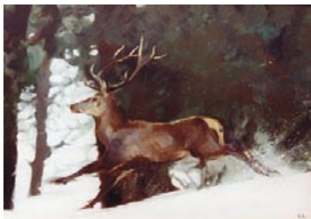
Opera di: Giusy Rampini "Cervo sulla neve"