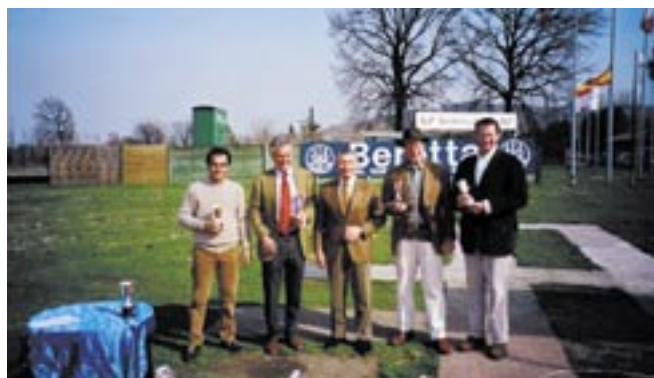
I vincitori al momento della premiazione.