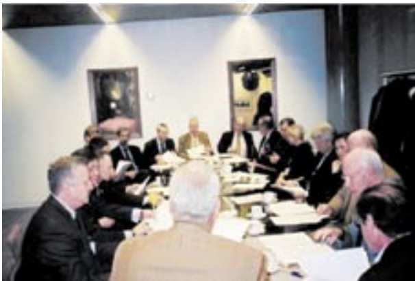
Riunione dei Presidenti dei Chapters europei S.C.I.