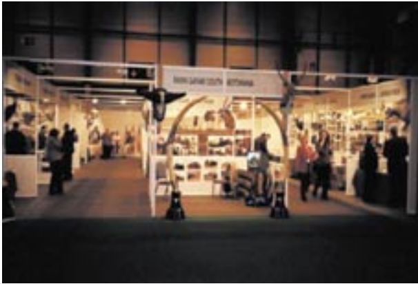
Panoramica degli stands