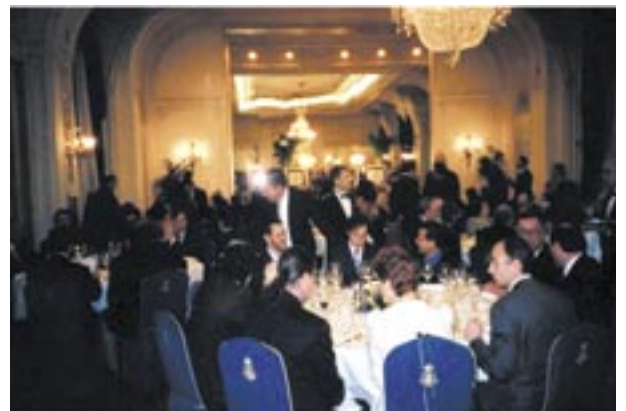
La cena di gala